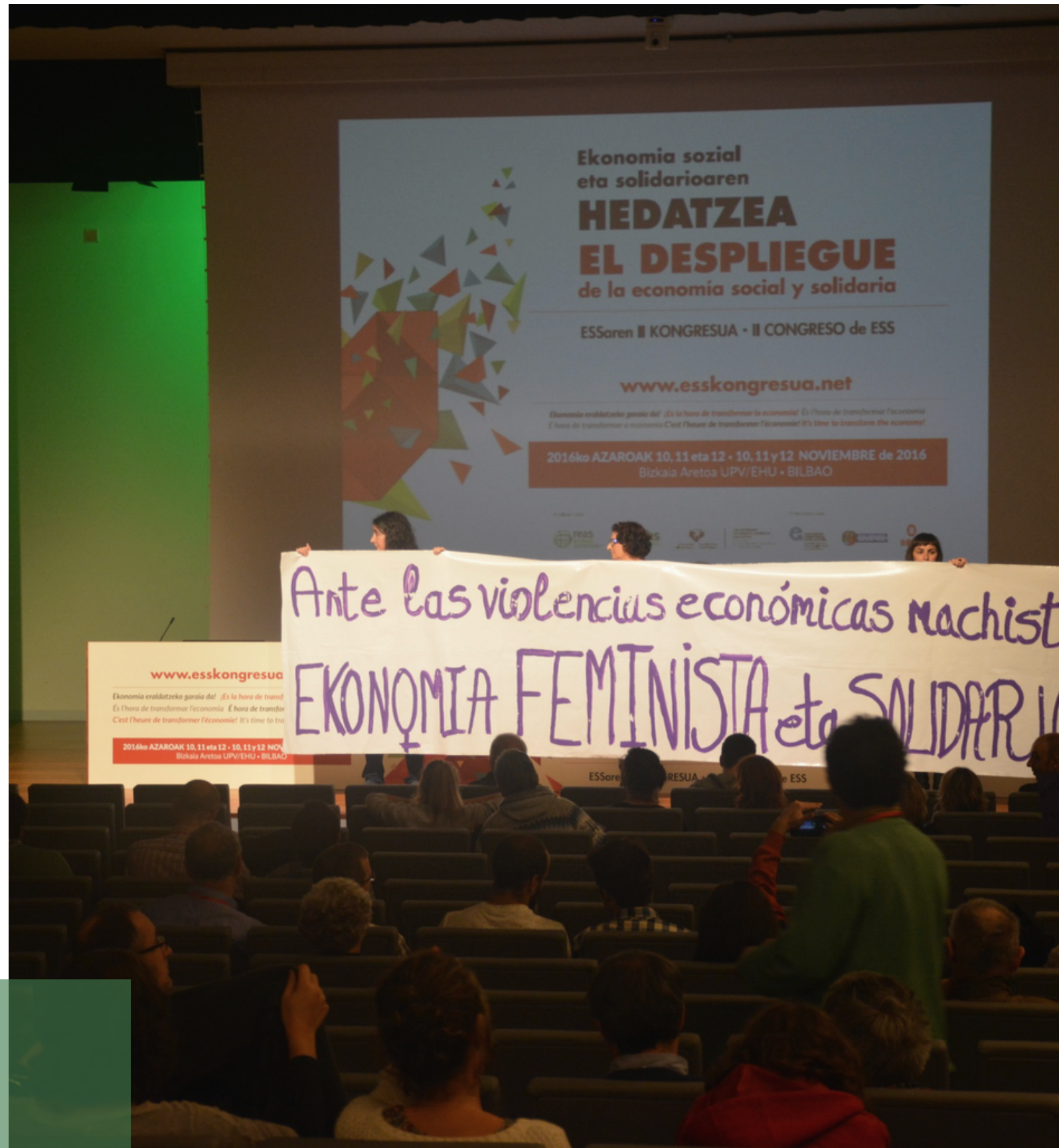
Imagen del II Congreso ESS en Bilbao (2016)