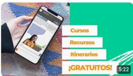
Recursos Formativos IntegralESS