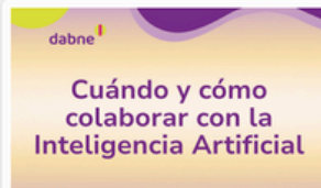
Curso «Cuándo y cómo colaborar con la inteligencia artificial»

Te llevamos de recorrido general por la página Experiencia Fundae, mostrando los diferentes recursos gratuitos para adquirir nuevas capacitaciones, certificar los conocimientos, conocer las competencias digitales, digitalizar las empresas o conocer los sectores más productivos. Leer más →