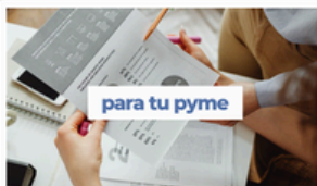
Recursos formativos para pymESS (vídeo)

Te introducimos en el universo formativo para Pymes de la plataforma pública de Fundae: todos los recursos y herramientas existentes presentados en este vídeo. Leer más →