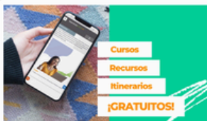
Recursos formativos IntegralESS (vídeo)

Te introducimos en el universo formativo para Pymes de la plataforma pública de Fundae: todos los recursos y herramientas existentes presentados en este vídeo. Leer más →