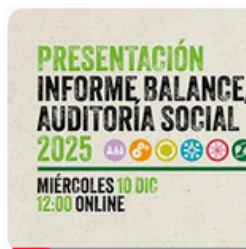
La Economía Social y Solidaria: informe de Auditor